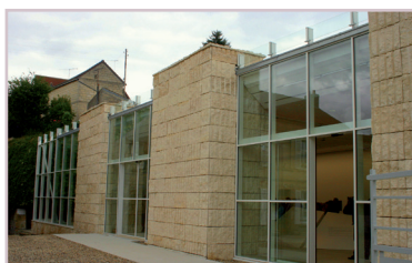
Maison de la Pierre Saint-Maximin Architecte : Bruno CROIZÉ 2008

Dans la vallée de l'Oise, l'art s'invite par petites touches au travers de réalisations et originalités architecturales, notamment pour des bâtiments de services, équipements ou d'ouvrage d'art remarquables tels :