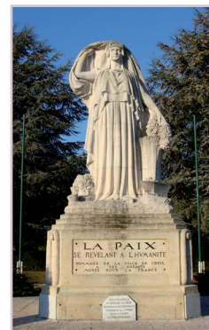
Monument aux morts. - Creil Sculpteur : Georges VEREZ. - 1923