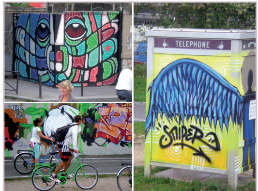
De l'art à l'Ourcq parcours sur 10 km Collectif d'artistes urbains Art Azoi été 2014 Plus d'info sur : http://artazoi.com/