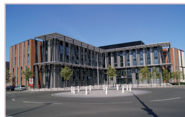
Bâtiment de l'entreprise Brezillon. - Margny-les-Compiègne Architecte : ARVAL. - 2013

Quelques éléments de statuaire viennent également ponctuer le paysage urbain.