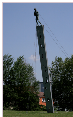
La marche. - Montataire Sculpteur : KASPER. - 2001