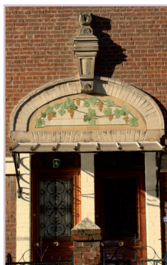
Détail sur une maison à Creil

D'autres réalisations privées plus discrètes apportent néanmoins une plus-value appréciable au bâtiment qu'elles décorent et plus largement à l'espace ou au quartier qu'elles agrémentent.