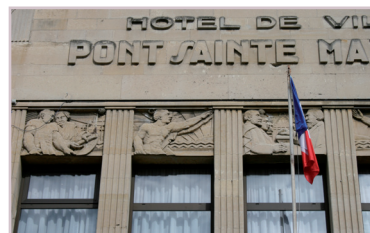
Hôtel de ville. - Pont-Sainte-Maxence Architecte : Jean PATTIN. - 1929