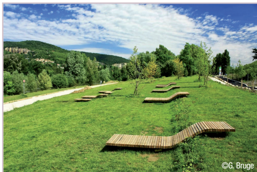
Rives de Saône. - Le Grand Lyon Le projet Rives de Saône s'inscrit dans la démarche de reconquête des fleuves sur un linéaire de 50 km. Au fil des aménagements et des œuvres, les concepteurs du projet réalisent une promenade alliant patrimoine naturel, historique et culturel, respectueuse de l'environnement, mettant en valeur et développant les usages liés à la Saône et à ses rives. Plus d'info : www.lesrivesdesaone.com