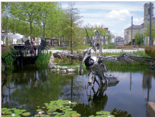
Place Napoléon. - La Roche-sur-Yon Architecte : Alexandre CHEMETOFF Artiste : François DELAROZIÈRE 2012 Plus d'info : www.ville-larochesuryon.fr