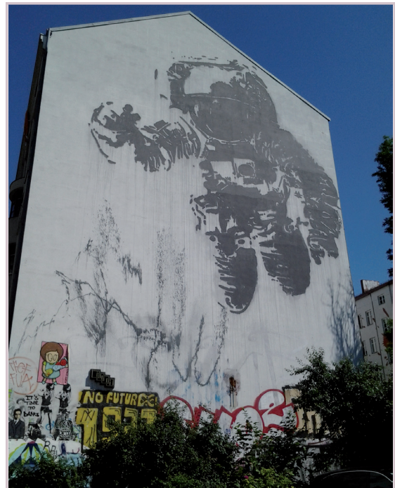
Manifestation de Street-art à Berlin

L'art est classiquement associé à la ville, à travers son architecture, sa statuaire, son mobilier urbain et tout autre édifice. Par des formes ou des détails singuliers, il participe à sa mémoire et formate son identité à travers ses vestiges archéologiques, son patrimoine religieux, urbain (décoration de façade, pont, fresque...), industriel (cité ouvrière, bâtiment ouvrier), militaire (casernes, monuments commémoratifs)... On parle aussi d'ouvrage d'art. Toutes ces formes d'art sont pour la plupart inventoriées, popularisées, voire labellisées. Mais l'art doit-il toujours être académique ? Après avoir associé l'art à la ville, les territoires aujourd'hui se demandent plutôt comment utiliser l'art pour faire la ville ou le paysage. On ne « fait » plus seulement de l'art pour embellir la ville, mais aussi et surtout pour révéler le potentiel des espaces, leur permettre de se démarquer et, de fait, pour transformer l'image des lieux et interpeller celui qui les traverse.