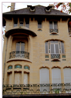
Villa Marcot.- Compiègne. - 1907 Architecte : Henri SAUVAGE Céramiste : Gentil et Bourdet Monument inscrit aux monuments historiques

Or, le contexte tend à s'y prêter, à l'instar des réalisations opérées dans des secteurs de vallées, de friches industrielles, ou en déficit d'image.