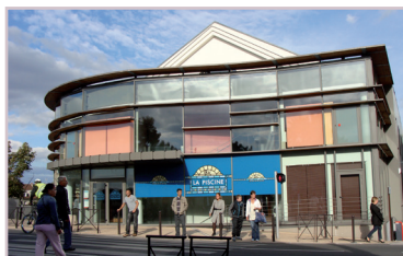
Piscine municipale. - Creil. - rénovée en 2013 Architecte : M. VERSCHUEREN