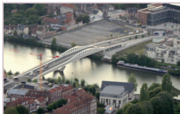
Pont Neuf. - Compiègne Architecte : Yves PAGÈS. - 2011