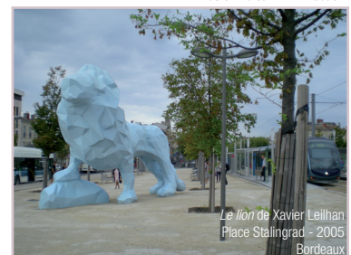
Le lion de Xavier Leilhan Place Stalingrad - 2005 Bordeaux

Exemple d'œuvre liée au « 1% artistique » mis en œuvre à Bordeaux dans le cadre de la construction du tramway. Plus d'info sur : www.lacub.fr