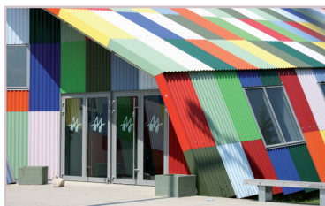
Espace de rencontres. - Montataire Architectes : Raphaële PERRON et Laurent CHARPIN. - 2007

Or, le contexte tend à s'y prêter, à l'instar des réalisations opérées dans des secteurs de vallées, de friches industrielles, ou en déficit d'image.