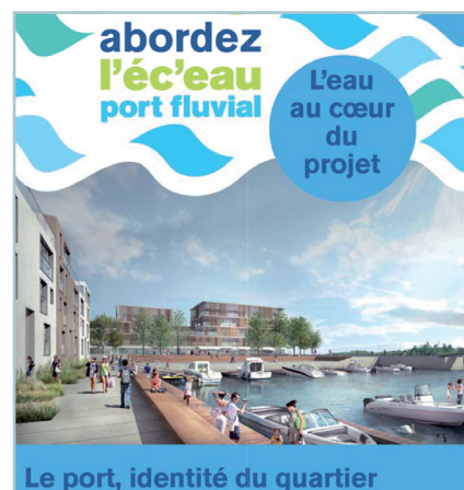
extrait de l'exposition Abordez l'éc'eau port fluvial, le nouveau quartier de Creil réalisée dans le cadre de la concertation publique Phase 2 du 4 novembre au 5 décembre 2013

D'autres initiatives, visant un aménagement raisonné de l'espace, sont actuellement en cours de gestation sur le territoire de la vallée. Pour exemple, Pont-Sainte-Maxence a inscrit un projet dans son PLU du 11 mars 2013, qui consiste en un quartier résidentiel situé dans le prolongement d'un secteur d'agriculture maraîchère aux fins d'encourager le développement de circuits courts de proximité.