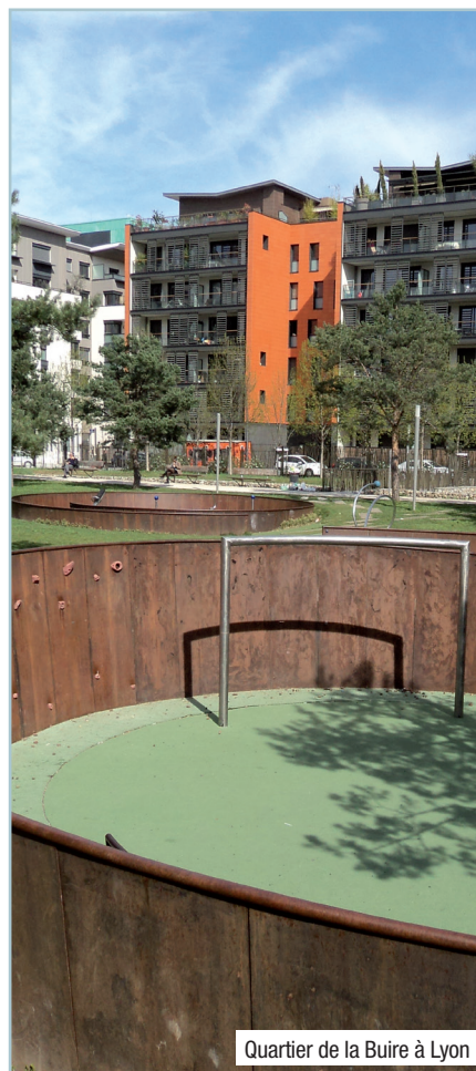
Quartier de la Buire à Lyon

Pour résumer, s'il a bien entendu pour objectif de réussir en soi, un éco-projet a pour mission de réussir à faire tendre à l'excellence un territoire tout entier, avec le concours des habitants et l'implication de tous les acteurs dès la conception du projet et au-delà de sa réalisation. Et c'est même sûrement à ce titre qu'il mérite le plus son qualificatif d'exemplaire.